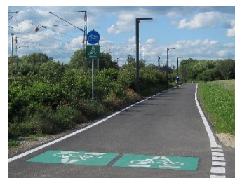
Radschnellweg Darmstadt – Frankfurt

Dieses Programm wird in den nächsten Jahren massiv aufgestockt, die Bundesmittel für „aktive Mobilität“ werden verzehnfacht. Damit ist auch ein Quantensprung bei der Infrastruktur finanzierbar: Ziel sind sogenannte Rad-Highways, die Kernstädte mit dem Umland möglichst direkt und kreuzungsfrei verbinden. Beispiele dafür finden sich in Kopenhagen, Amsterdam oder auch in deutschen Ballungsräumen.